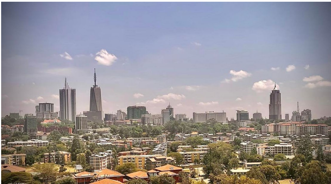
Utsikten från taket på WilsonView

På den positiva sidan var det väldigt smidigt att bo så nära skolan, och på översta våningen (15:e) fanns gym, biljardbord och en uteplats med utsikt över hela staden. Det fanns också en liten kiosk på bottenvåningen vilket var smidigt. Men om någon annan funderar på att göra utbytet skulle jag ändå rekommendera att hitta ett eget ställe att bo på, eller att söka en annan studentbostad än denna.