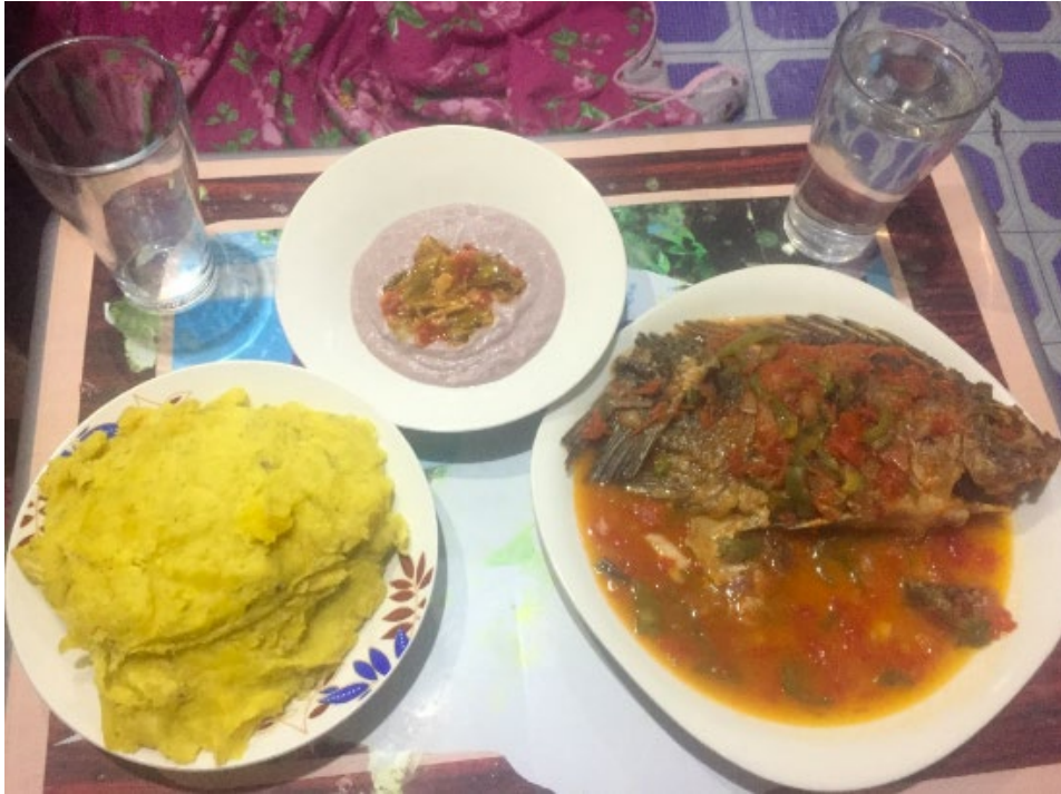
Middag hos en bekant som lagat mat från sitt hemland Uganda.

En sista sak om Kenya är att dess historia är väldigt viktig att känna till för att förstå hur landet är idag. Ett exempel är stammarna; innan kolonialismen fanns ingen nationell identitet i regionen utan befolkningen tillhörde olika stammar. Det är fortfarande en viktig identitet för många. Många röstar på politiker som tillhör deras stam eller föredrar att gifta sig inom stammen (det är vanligare i den äldre generationen). Stammarna har ursprung från olika delar av landet och det kan finnas stora kulturskillnader dem emellan. Det är en aspekt av Kenya som inte är så tydlig först men som märks av alltmer med tiden och som kan vara givande att lära sig mer om.