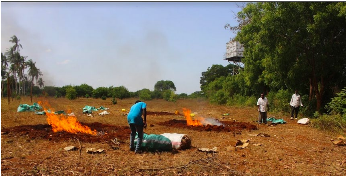
Biokolstillverkning under forskningskick-off