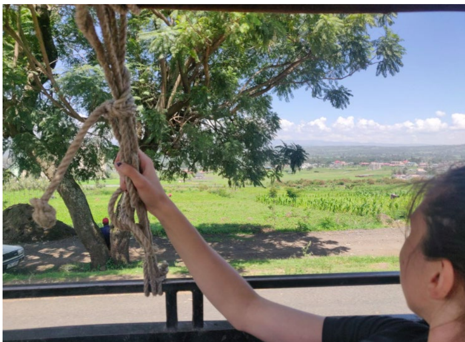
På resande fot uppåt landet