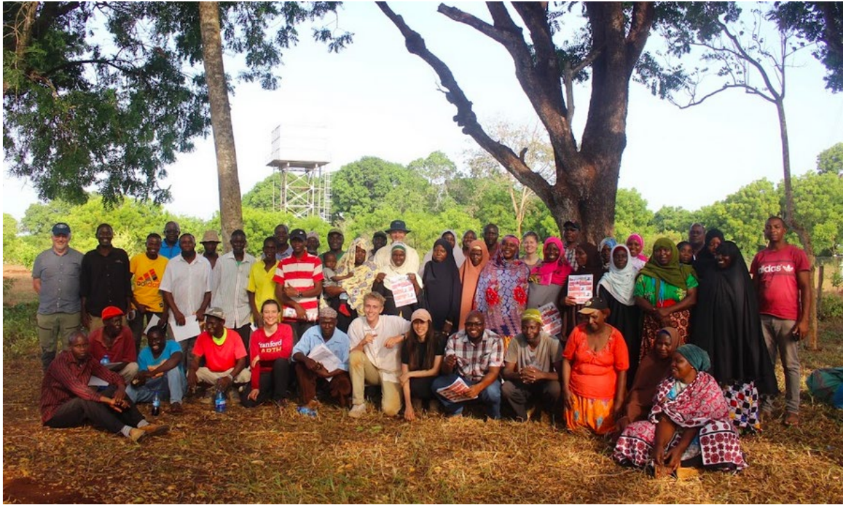
Gruppen från forskningskick-off

Jag kom fram två veckor innan terminen på Strathmore började. Det var en del att fixa med först; kenyanskt mobilnummer, passerkort i skolan, boende m.m. så det var smidigt att komma innan kursstart. Vår handledare hade bjudit in mig och min vän (som jag skrev kexet med) att delta i en forskningskick-off i kuststaden Diani i slutet av mars, så efter bara några dagar i Nairobi åkte vi dit. Där spenderade vi en vecka med att vara med på forskningsprojektet, som handlade om ett ämne liknande det vi skrev vår uppsats om. Sen gjorde vi första delen av vår fältstudie i Kwale, en ort nära Diani. Vi kom hem dagen innan terminen började.