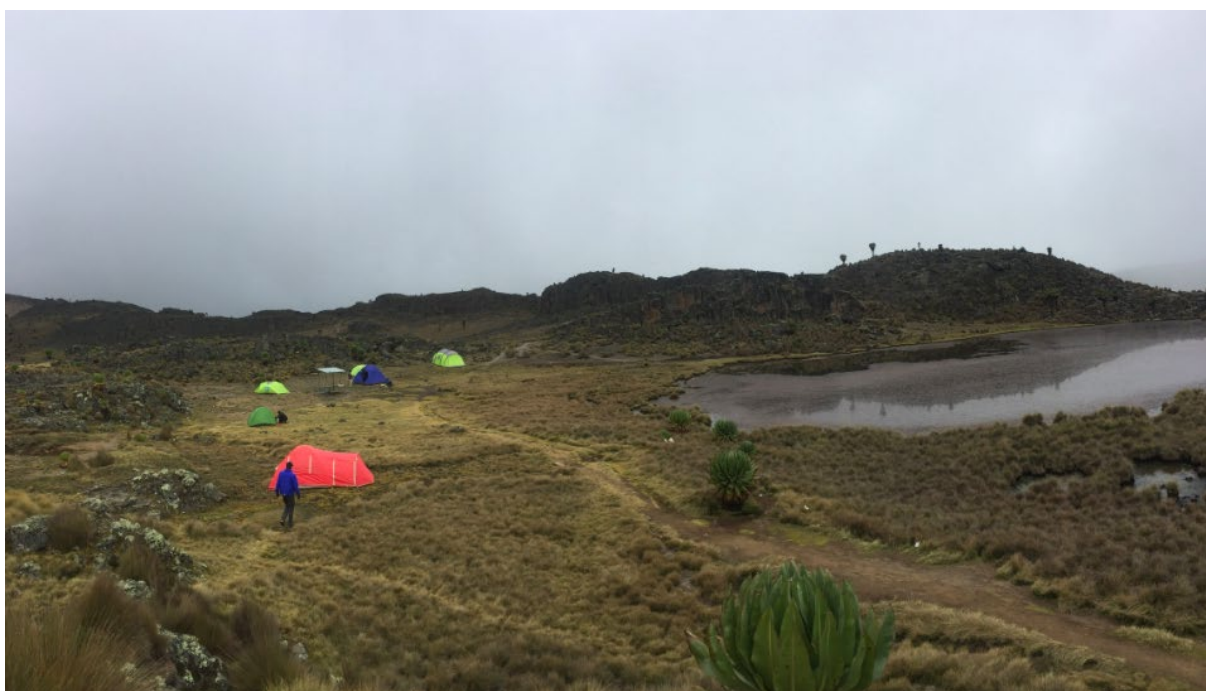
Mount Kenya, camping kvällen innan bestigning av toppen

I Nairobi tränade jag ganska mycket. Jag gick på kickboxning och hittade ett lag att spela fotboll med. Strathmore hade också en trevlig idrottsplats där man kunde springa eller gymma, och de hade ett 18-kilometerslopp genom staden som jag och en kompis deltog i. Det var också trevligt att se sig om i staden och lära känna centrum och de olika stadsdelarna. Jag och några vänner hittade en restaurang, Kilimanjaro, som blev ett favoritställe att äta på. En gång hittade jag vad som i värsta fall var en getögonfrans och i bästa fall en pälsbit från en svans i maten vilken sänkte entusiasmen för stället, men det kan vara värt att besöka ändå! Det finns också en del skogsområden och natur om man gillar sånt. Generellt sett måste man betala inträde för att besöka naturområden i Kenya, och ganska mycket om du inte är "resident", men i Nairobi finns några skogsområden dit man kan åka gratis eller ganska billigt. Ngong Hills är väldigt trevligt till exempel.